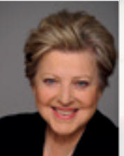
► Marie Luise Marjan